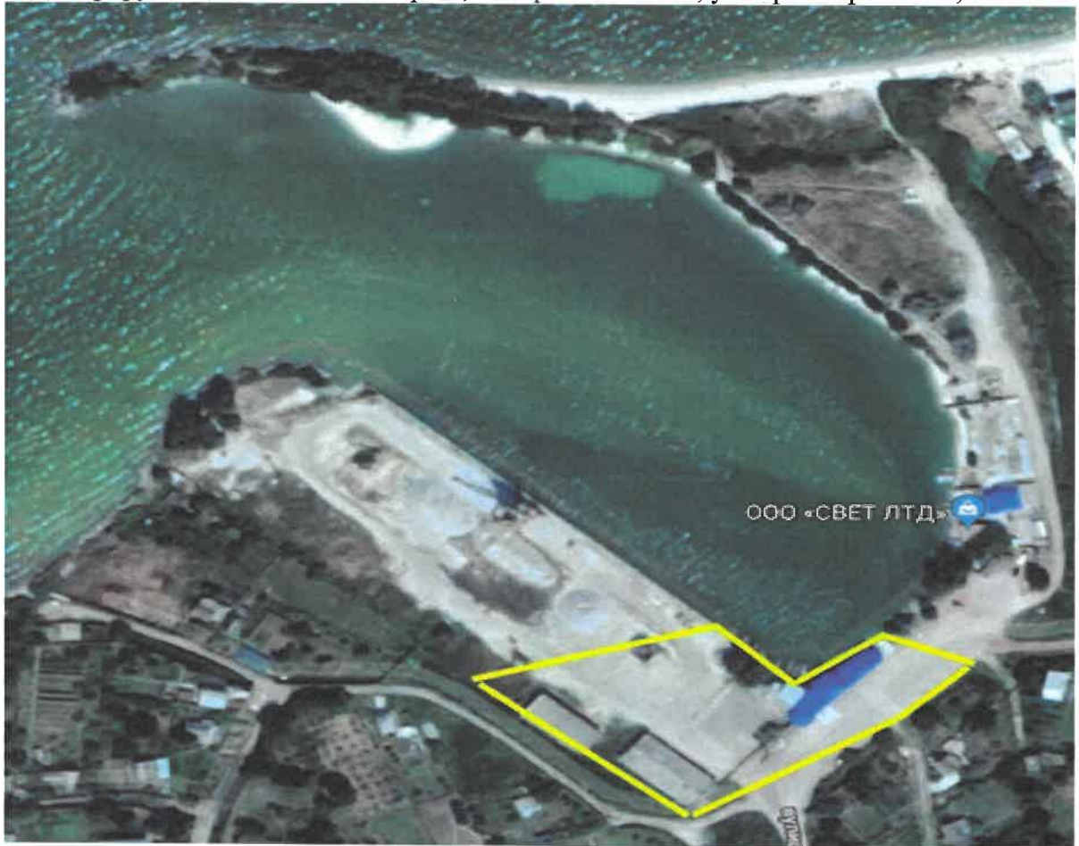
Схема границы территории Никопольского речного порта г. Никополь, Днепропетровской обл., улица Крупской, 26

г. Днепрорудное, Васильевского р-на, Запорожской обл., ул. Краснофлотская, №73